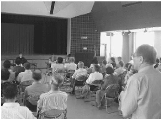
会場からも多くの質問が

2区総支部が6月15日(土)守山区役所講堂にて、「地域の元気は日本の元気」と題し、地域活性化フォーラムを、総勢82名の支援者の参加のもと開催された。