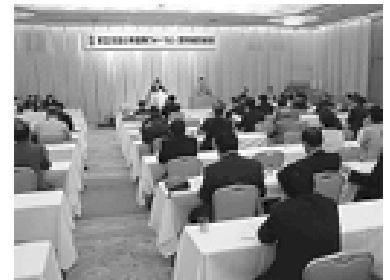
熱心に聞入る自治体議員

また、政策調査会がまとめた「基本となる愛知の政策目標」を基調に活動方針が提案され、来年6月を目途に活動をスタートさせることを確認した。