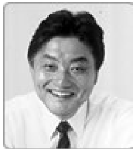
1区 河村 たかし