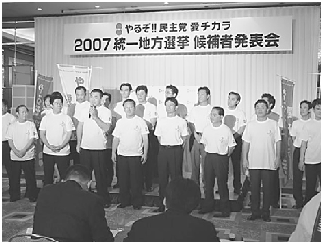
記者会見で自己紹介をする県・名古屋市会候補予定者たち

10月14日、市内ホテルにて統一地方選「第4次候補」発表と新人候補予定者36名で組織する勉強会「新風あゆち」の記者発表が行われ同時に、知事選、統一地方選、参議院選の総合対策本部(本部長:近藤昭一県連代表)の立ち上げ発表が行われた。