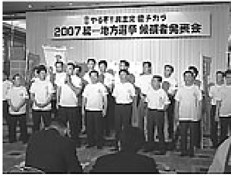
「新風あゆち」記者発表模様